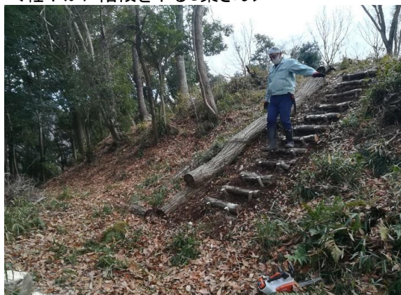
＜軽やかに階段を下るC葉さん＞