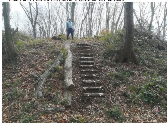
＜3カ所目の階段が完成しました＞