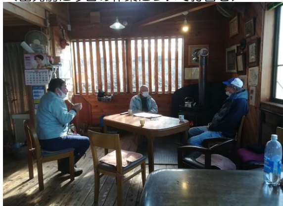
＜出発前に今日の作業について打合せ＞