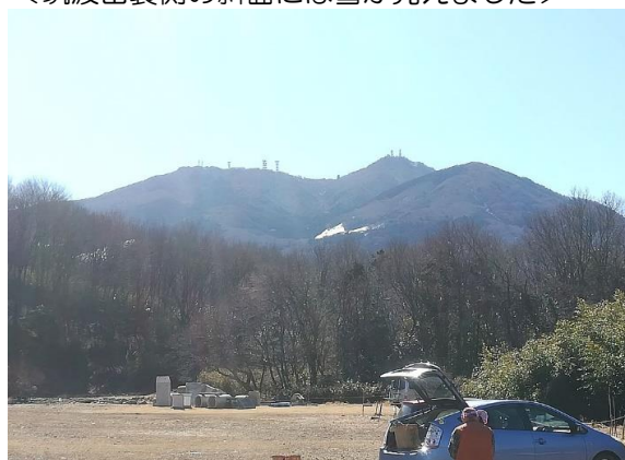
＜筑波山裏側の斜面には雪が見えました＞