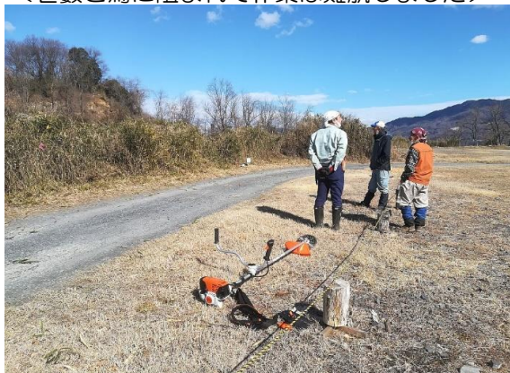
＜笹藪と蔦に阻まれて作業は難航しました＞