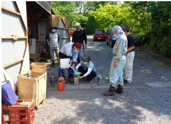
<出発前に燃料づくり>