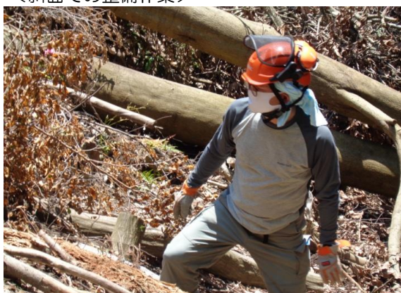
<斜面での整備作業>