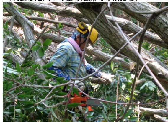
<伐倒した大木の宙の足場での枝打ち>