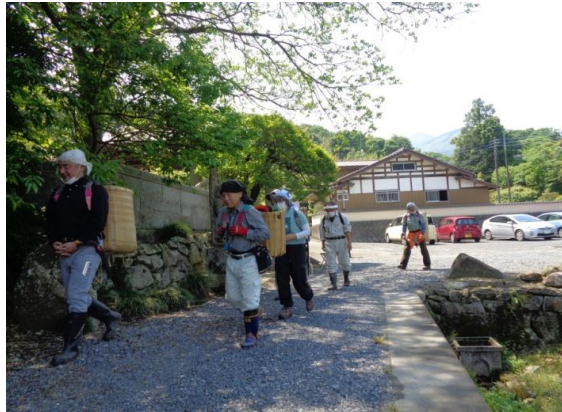
<いざ、現場に向けて登山開始>