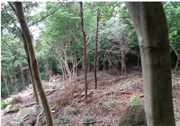
<今日はこの方面を>