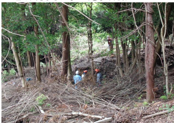
<日が入るようになってきましたね>