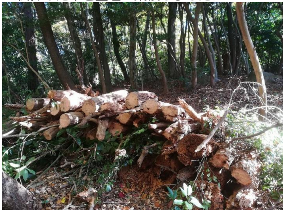
<伐採した木を整理・集積しました>