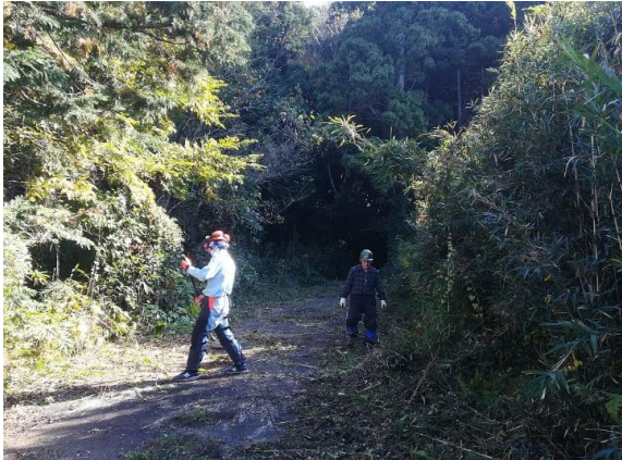
<登山道入り口付近の草刈り整備>