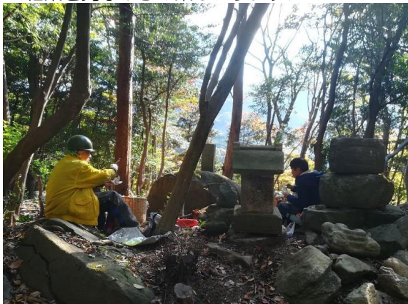
<紅葉を見ながらの楽しいランチ>