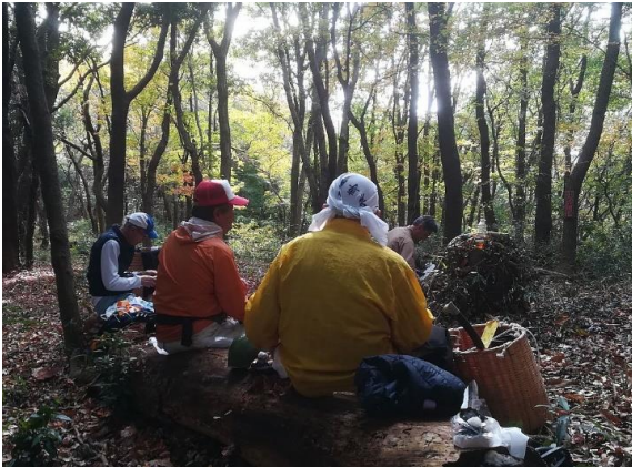
<紅葉を見ながらの楽しいランチ>