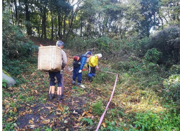
<将来計画に備えて準備作業しながら登る>