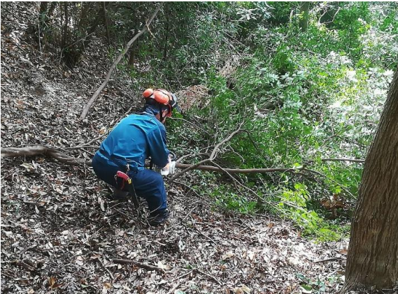
<急斜面での伐採作業>