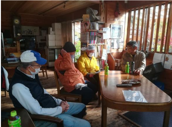
<今日の予定を打合せ・確認中>