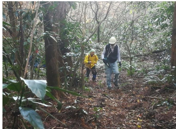
<富士権現目指してひたすら登る>