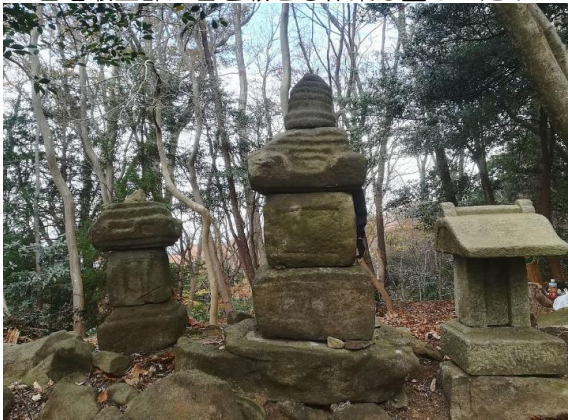
<石塔最上部に石を載せる作業は重かった！>