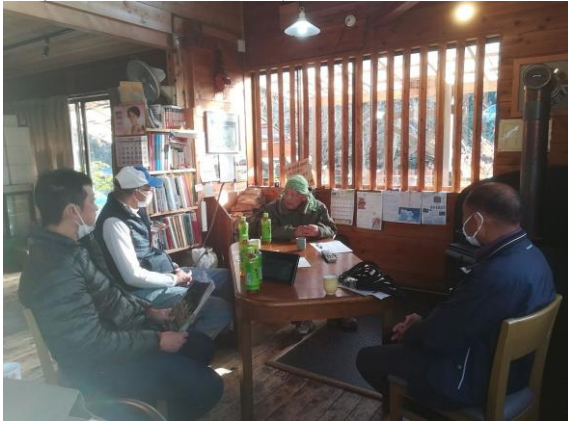
<今日の予定を打合せ中>