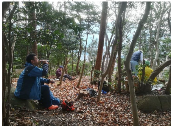
<作業後は富士権現で楽しい昼食>