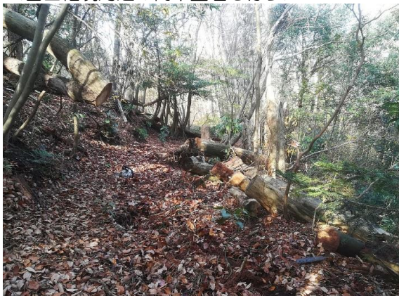
<富士権現周辺の倒木整理も行う>