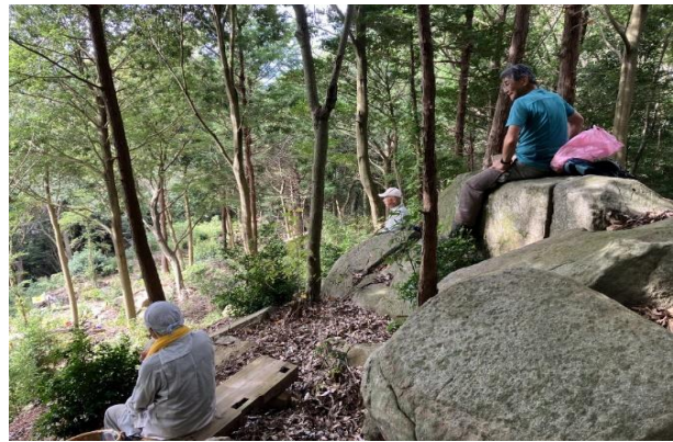
<お昼ごはんはベンチに座って頂きます>