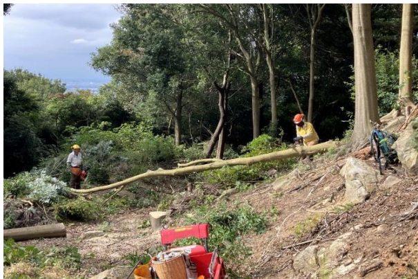
<見晴らしを確保するための伐採です>