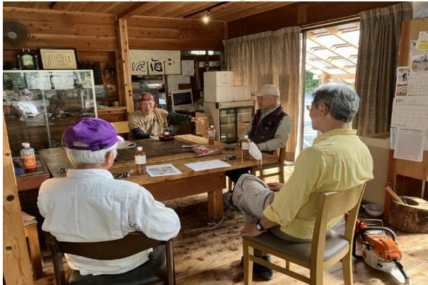
<久しぶりの顔合わせと打ち合わせ>