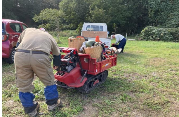
<軽トラから下した運搬車で荷物を運ぶ>